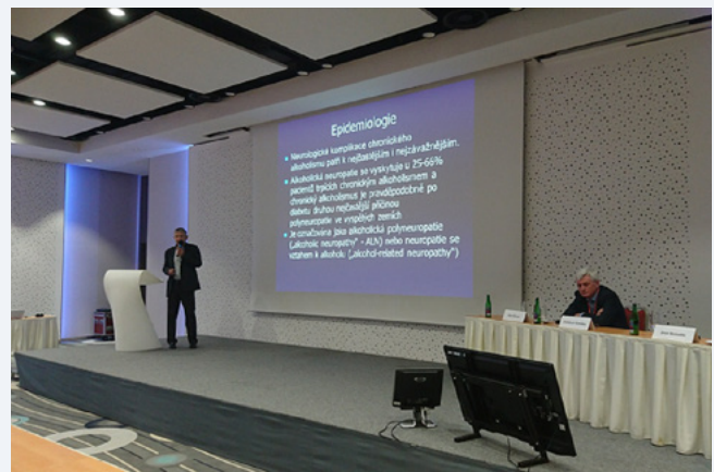
Úvodní blok přednášek