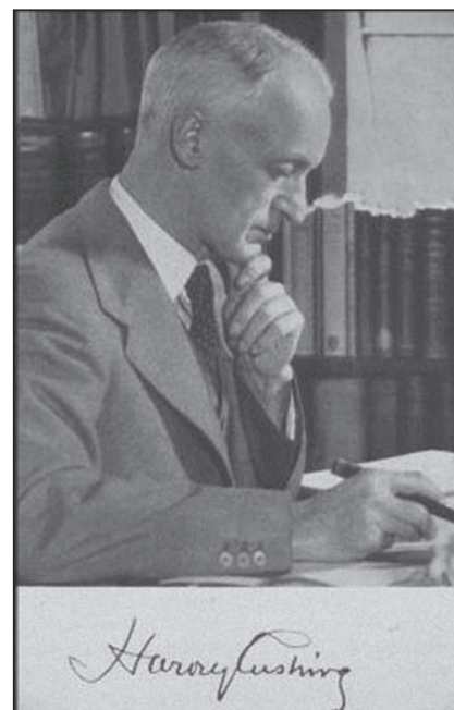
Obr. 1. H. W. Cushing.

Jeho život je podrobně popsán v několika knihách, které se liší jen temperamen-tem autora a jeho vztahem k hrdinovi. Práci jim usnadnil sám Harvey. Měl totiž vlastnost, kterou mu závidím, protože se mi jí nedostává. Harvey byl systematick, pedant, puntičkář, zkrátka zapsal všechno, co udělal a prožil. Po Cushingovi zůstaly zásluhou několika jeho obdivovatelů snad tisíce dopisů, všechny jeho články, knihy, dokonce všechny chorobopisy jeho pacientů, včetně chorobopisů vojáků, které