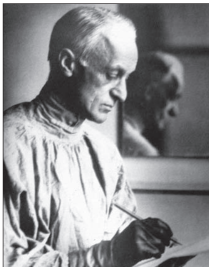
Obr.4. Nejznámější fotografie zakladatele neurochirurgie. Tu podepsal i Arnoldu Jiráskovi.